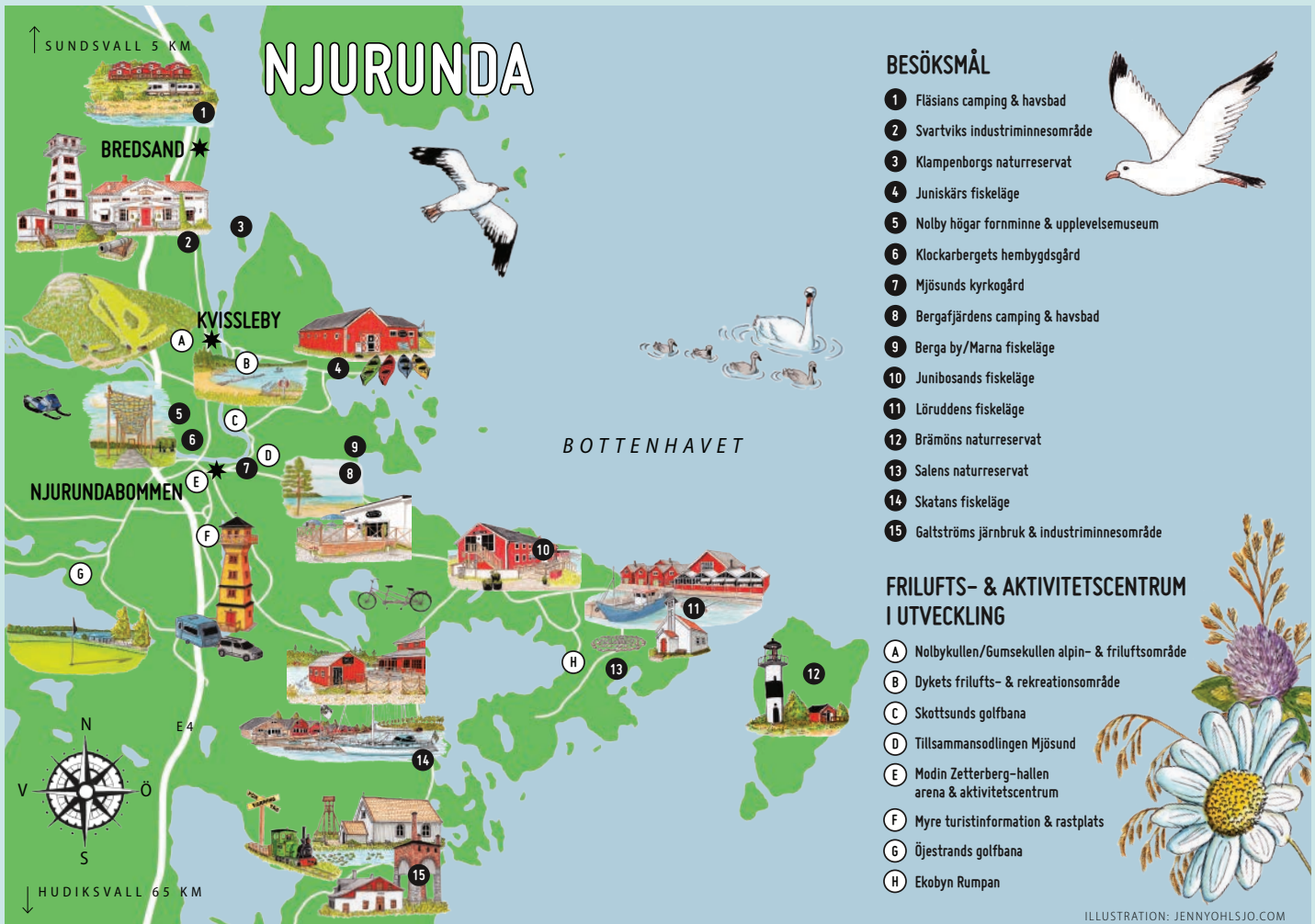
ILLUSTRATION: JENNY OHLSJÖ

material samlats in genom intervjuer, enkäter, möten och samtal. Resultatet presenteras i broschyren, tillsammans med en plan över hur utvecklingsarbetet ska ta fart och göra skillnad både nu och framåt.